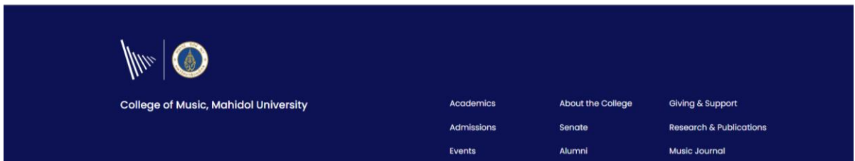
ภาพที่ 2 ภาพแสดงโปสเตอร์ประชาสัมพันธ์นโยบายและแนวปฏิบัติไม่รับของขวัญ และของกำนัลจากการปฏิบัติหน้าที่ ผ่านทางเว็บไซต์หลักของวิทยาลัย