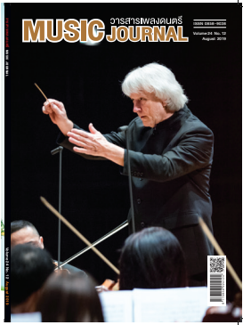
Volume 24 No. 12 August 2019

สวัสดีเดือนสิงหาคม... เพลงดนตรี ขอต้อนรับผู้อ่านด้วยความจากคุณบดี เกี่ยวกับการเรียนรู้ผ่านประสบการณ์ตรง ในชีวิต นอกเหนือไปจากการเรียนรู้ใน ห้องเรียน ซึ่งการเรียนรู้ผ่านประสบการณ์ ตรงนั้น สามารถเกิดขึ้นได้จากหลากหลาย สถานการณ์ เช่น จากการเดินทาง หรือ จากการได้ร่วมงานกับนักดนตรีระดับโลก โดยการเรียนรู้ในรูปแบบนี้ สามารถสร้าง แรงบันดาลใจและเปลี่ยนมุมมองของผู้เรียน ได้อย่างมาก